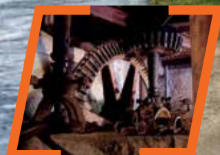
[MOULIN DE BOITORGUEIL]