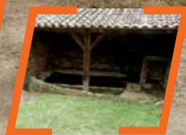
[LAVOIR DE RABALOT]