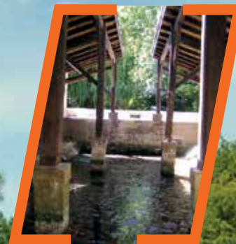
[LAVOIR DE LOUBEAU]