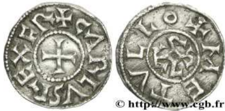
Denier de Charles II Le Chauve frappé à Melle