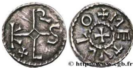
Obole de Charles II Le Chauve frappée à Melle